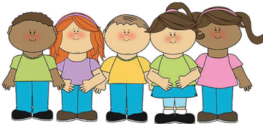
Paul Anne Andrew Maria Lora

Cerință 2: Răspunde la următoarele întrebări și completează spațiile libere, ținând cont de indicații și imagini: