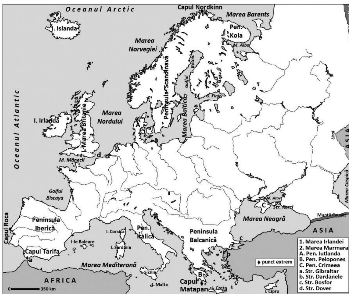
Fig. 1. Spațiul european

d. strâmțori: Kerçi (leagă mările Azov și Neagră), Bosfor (între Europa și Asia, leagă mările Neagră și Marea Marmara), Dardanele (între Europa și Asia, leagă mările Marmara și Egee), Messina (între Peninsula Calabria și Insula Sicilia, leagă mările Ionică și Tireniană), Gibraltar (între Europa și Africa, leagă Marea Mediterană de Oceanul Atlantic), Pas de Calais/Dover (leagă mările Mânecii și Nordului) etc.