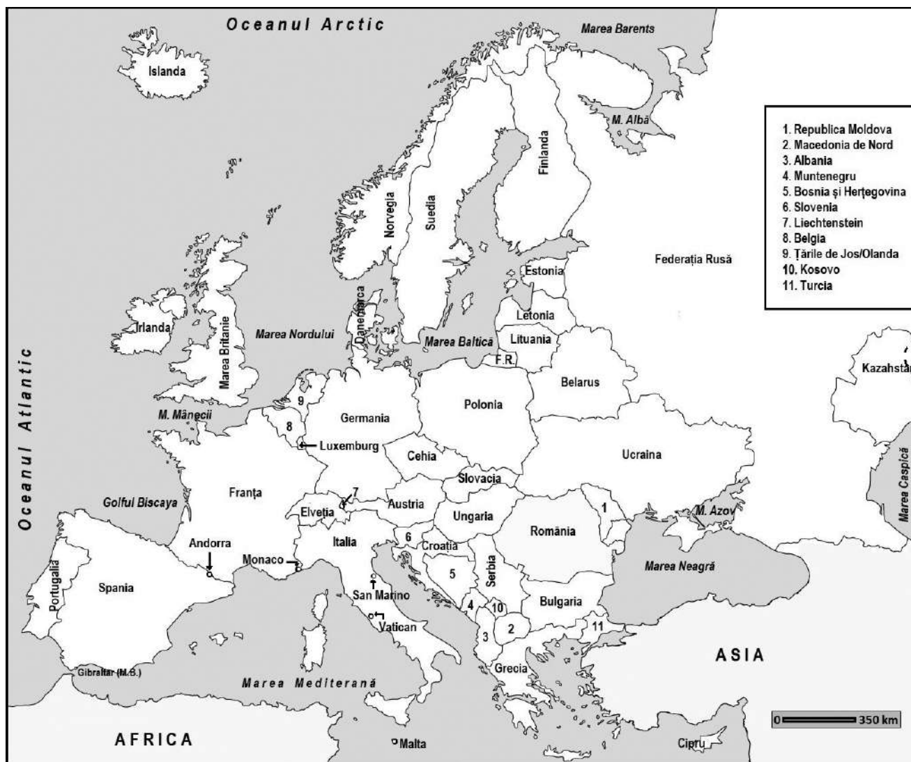
Fig. 2. Europa – harta politică

În prezent, spațiul european este administrat de 48 de state (fig. 2), dintre care unul cu recunoaștere parțială (Kosovo) și două care aparțin, prin poziția geografică a capitalei, Asiei (Kazahstan și Turcia).